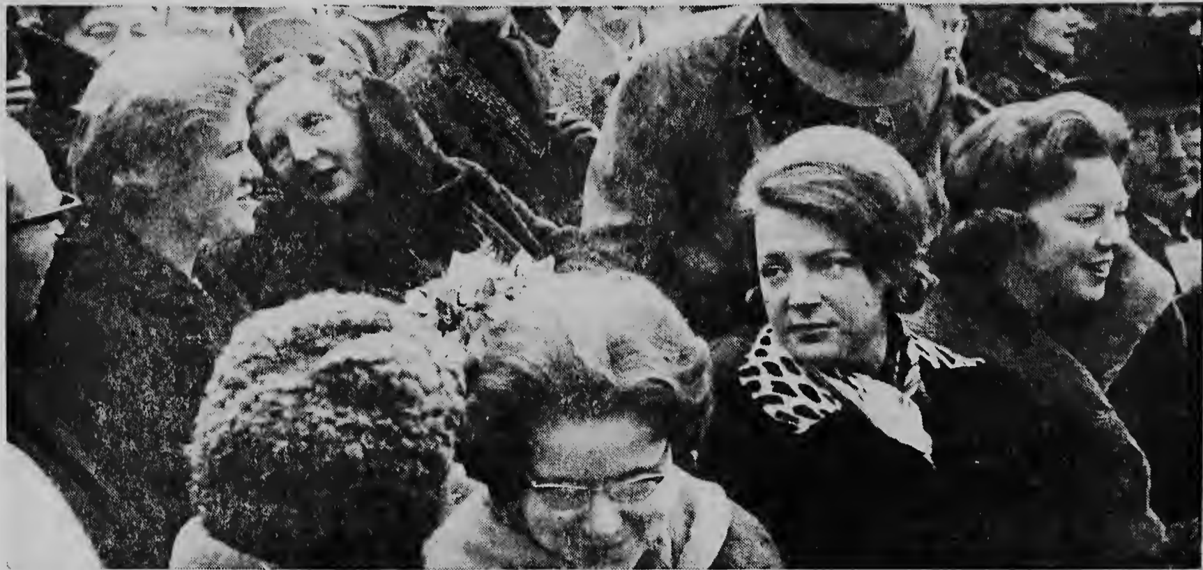
La Reina Juliana y e princesanan Beatrix, Irene y Marijke a presente na Amsterdam na ocasion di homenahe personal dje campeona mundial kunstrijden riba schaats, Sjoukje Dijkstra. E campeona mundial a goza di e honor di por a salta 10 minuut banda di La Reina. Riba e portret aqui di dje pa drechi: La Reina Juliana y den e fila su dilanti: e princesanan Marijke, Irene y Beatrix.